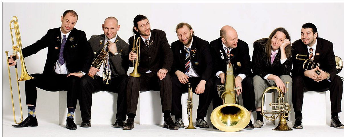
Von Schlager bis zur Operette: Mnozil Brass vereinen Bläsersound mit Musikkabarett.

Das beginnt beim Eröffnungskonzert mit den Echo-Klassik-Preisträgern des Aurny-Quartetts, die zusammen mit dem Minguet-Quartett Mendelssohns prächtiges