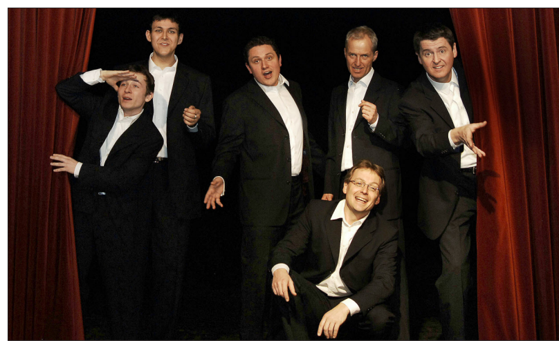
Von Renaissance bis Pop und Jazz: die Singphoniker